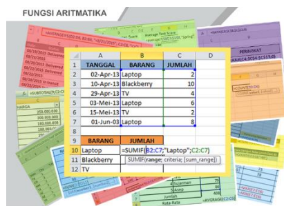
Penggunaan Fungsi Aritmatika

Mengajarkan penggunaan formula excel level intermediate untuk mengolah data serta menyajikan laporan dengan cepat dan akurat.