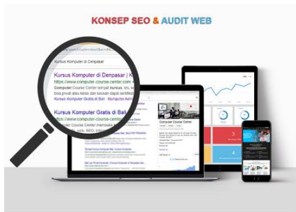
Proses Audit Website

Kursus SEO mengajarkan cara mengoptimalkan web agar bisa menempati posisi bagus di search engine secara organik dengan teknik White Hat.